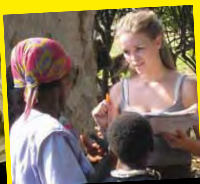
Jubileumuitgave van Stichting Run for Rio, december 2012