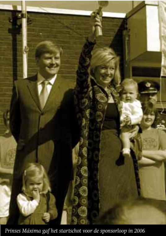
Prinses Máxima gaf het startschot voor de sponsorloop in 2006

2006: Run for Rio en ScholenCollectief Wassenaar organiseren projectweken met als thema 'alle kinderen naar school'.