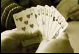
Klaverjassen en bridgen