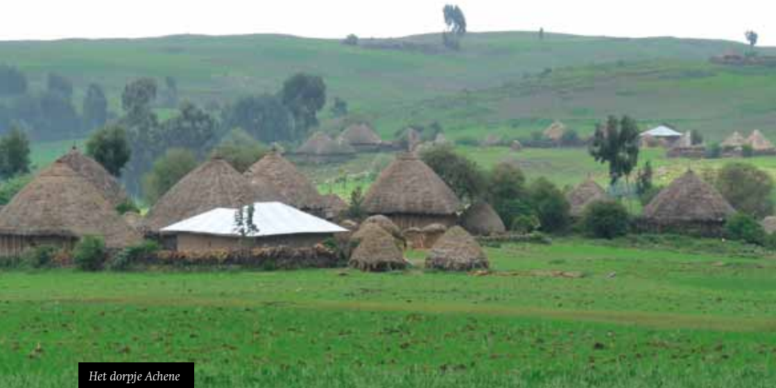
Het dorpje Achene