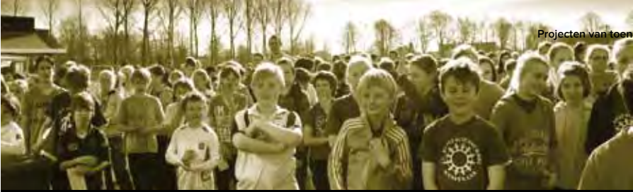
Wassenaarse basisscholieren en brugklassers liepen vol enthousiasme mee met de sponsorloop voor stichting Dinka

de jongens en meisjes gescheiden in één gebouw gaan slapen. In de toekomst zal elke groep een eigen slaapgebouw krijgen. In deze slaapzaal is ook een wasruimte gerealiseerd waarin de “mamma’s” de was van de kinderen kunnen doen. “Mamma’s” zijn lokale vrouwen, die in de school de zorg voor de kinderen op zich zullen nemen. In september 2012 is de eerste fase van het project hiermee afgesloten.