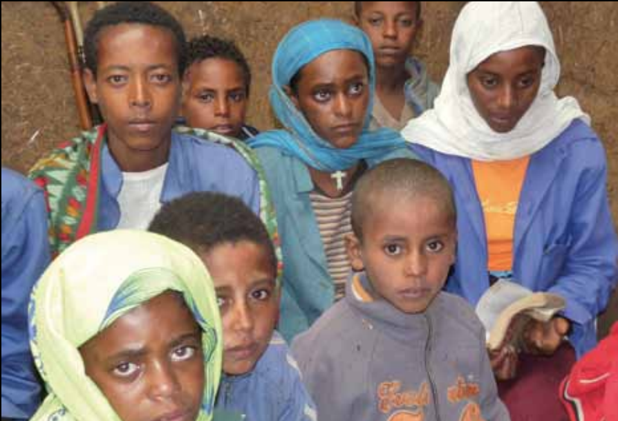
Schoolgaande kinderen uit Achene en omgeving