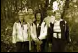
Een deel van de wandelgroep

In het stukje geschiedenis van de stichting ('Hoe is het allemaal gelopen....') heeft u kunnen lezen dat Run for Rio hardlopen als oorspronkelijke kernactiviteit heeft om tot fondswerving te komen. Deze activiteit is 25 jaar later nog steeds één van de pijlers van de stichting. De hardlopers doen mee aan hardloopevenementen door het hele land en soms zelfs in het buitenland.